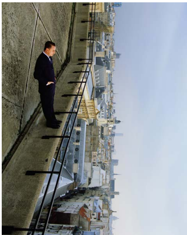
Philippe Ramette, Contemplation irrationnelle , 2003 Photographie, 150 x 120 cm, © Adagp, Paris, 2007

Son développement au fil du temps est le fruit d'une politique d'acquisition constante et cohérente, qui associe les forces vives de l'entreprise : chaque année, de nouvelles œuvres sont sélectionnées par un comité réunissant des experts du monde de l'art et des amateurs éclairés, choisis parmi les collaborateurs du Groupe, recrutés par appel à candidatures interne. Leurs propositions sont ensuite présentées au comité d'acquisition réunissant plusieurs membres de la Direction générale.