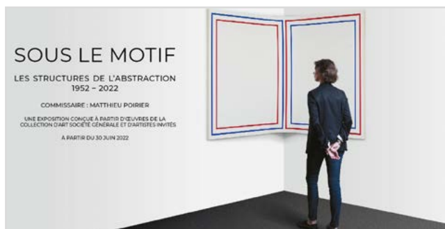
Stéphane Dafflon, AST126 , 2009