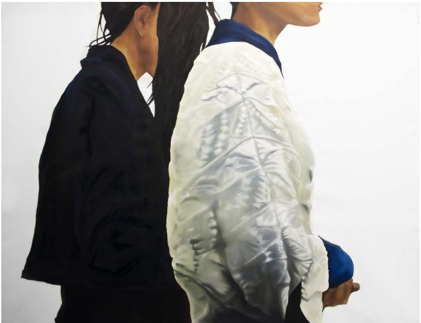
Axel Roy, Extrait de sans titre 057 , 2021 Peinture, 200 x 260 cm