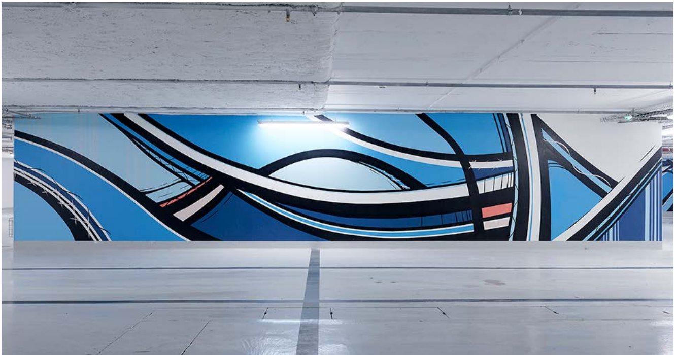
Romain Froquet , Sans titre , 2016, peinture en bombe

En complément de ces concours, Société Générale travaille étroitement avec ses services immobiliers pour inviter l'art dans ses bureaux. Ainsi, pour inaugurer le technopôle de Val de Fontenay, « Les Dunes », le Groupe a sollicité la créativité et le talent de huit street artistes sélectionnés à l'issue d'un appel à projets : Takt et Sueb du Collectif 3HC, Romain Froquet, le Collectif OnOff, Tétar, Goddog, Monsieur XXX et Stoul. Ces artistes aux approches et aux styles variés sont intervenus dans le parking de 5000 m 2 de l'ensemble immobilier. Leurs vastes fresques explorent la plasticité d'un média, la peinture, et réinventent la signalétique du lieu. Les artistes Takt & Sueb ont également réalisé une fresque panoramique au rez-de-chaussée : elle évoque la voie lactée, les constellations astrales, les triangulations de Delaunay, avec pour toile de fond les quatre saisons.