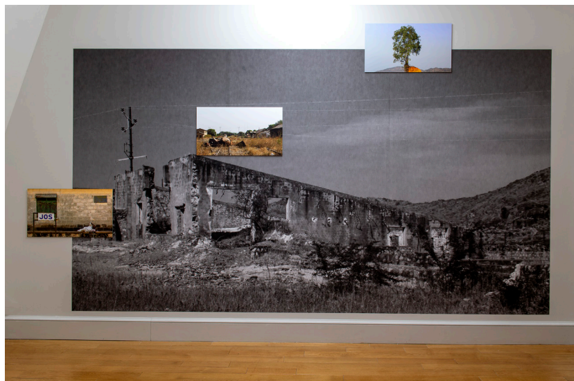
Abraham Oghobase, Anatomy of Landscape - Jos , 2018, Photographies et Papier peint ; collection KADIST ; Vue de l'installation à Labanque, Bethune, 2019 Courtesy Abraham Oghobase Photo : Marc Damage, Labanque.