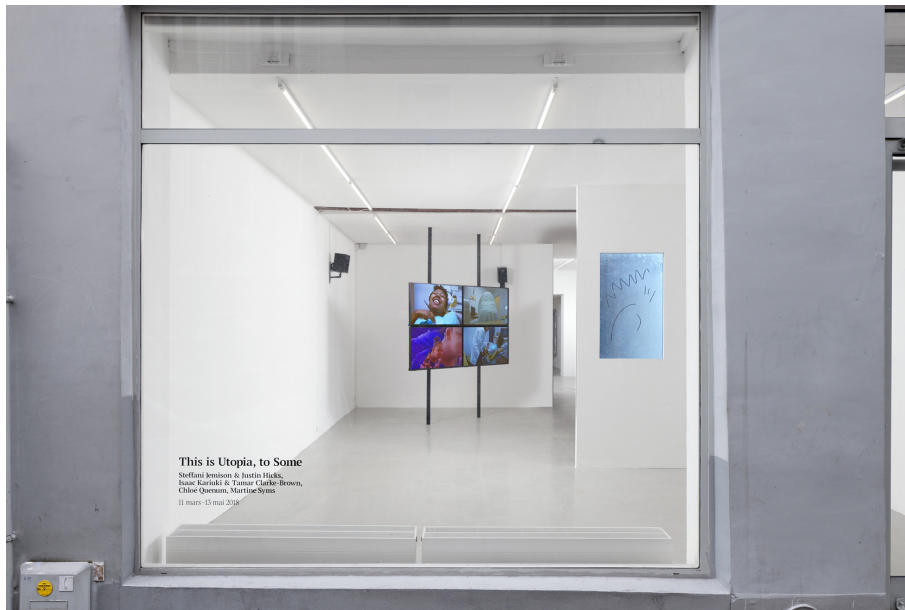
This is Utopia, to Some , 2018, KADIST, Paris.

Pour KADIST, l'art est moteur de transformation sociale, les artistes abordant souvent des questions clés de notre époque. Organisation à but non lucratif, KADIST soutient l'engagement des artistes représentés dans sa collection et se consacre à diffuser leurs oeuvres afin d'affirmer la place nécessaire de l'art contemporain au coeur des débats de société. Ses programmes sont le fruit de collaborations avec des artistes, des commissaires d'exposition et des institutions artistiques du monde entier, facilitant ainsi de nouveaux échanges entre les cultures. Ses expositions, résidences, évènements et programmes éducatifs développés localement dans les deux lieux permanents de KADIST à Paris et San Francisco, ainsi que ses programmes en ligne, favorisent de riches conversations sur l'art et la société.