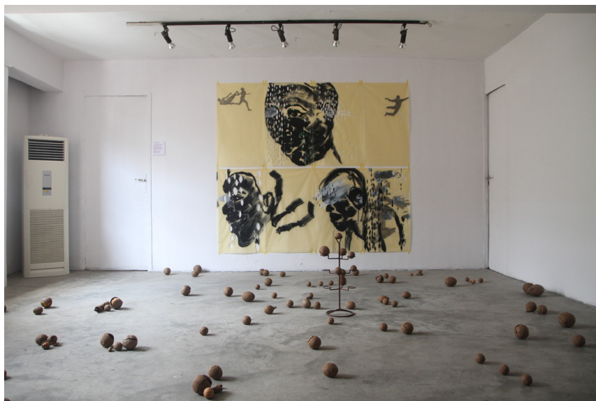
Vue de l'installation au CCA, Lagos