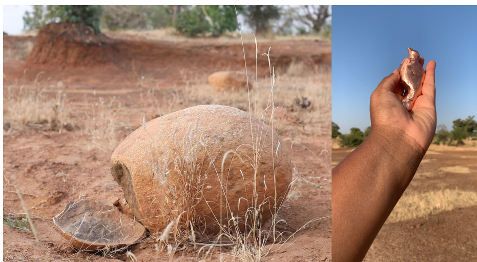
Rahima Gambo, Instruments of Air , 2021, Video still, une partie du projet Nest-Works and Wander-lines