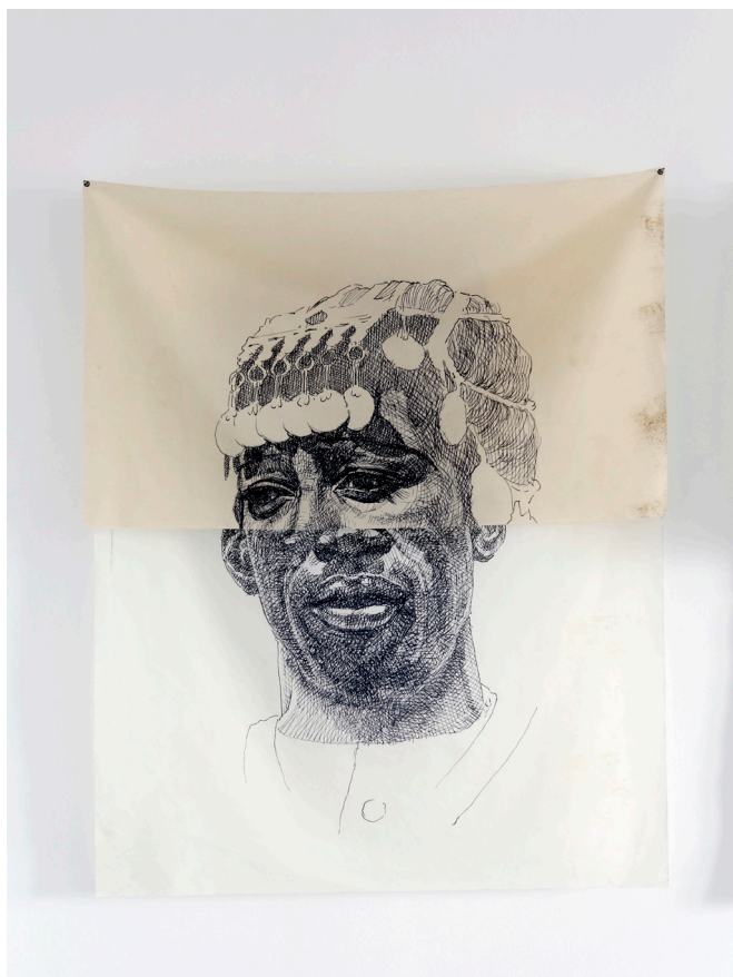
Nidhal Chamekh, Nos visages C , 2019, Transfert sur tissu ; collection KADIST ; Courtesy Nidhal Chamekh et Selma Feriani Gallery