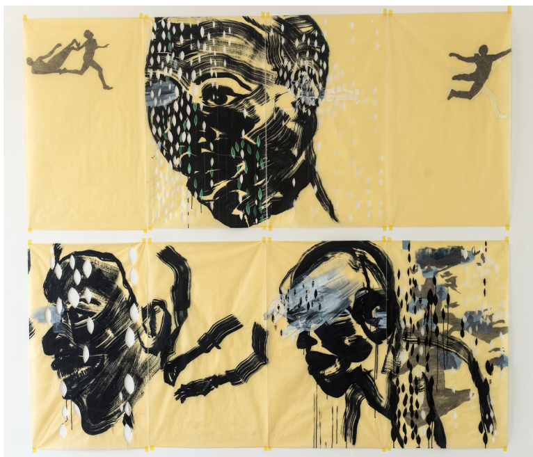
Wura-Natasha Ogunji, Fixed Things and Flying Things the body in parts, here and there the world in parts Atlantic Lace, Balogun Market Sound Man hears the wind We've passed this way before (Duck, don't stumble. They sold us before and they'll sell us again.) Sound Man sees the wind Follow me closely now, 2019, Fil, encre, graphite sur papier calque ; collection KADIST