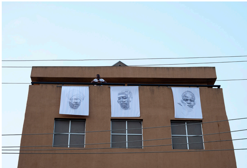
Nidhal Chamekh, Nos Visages , 2019 ; Vue de l'installation au CCA, Lagos ; Courtesy Nidhal Chamekh ; Photo : Abraham Oghobase, CCA, Lagos