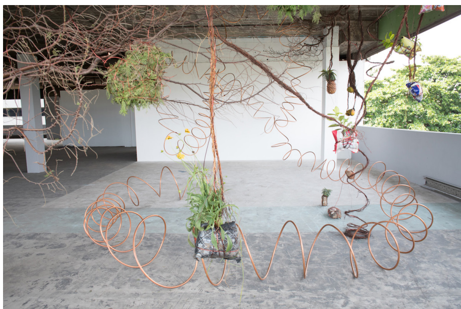
Rahima Gambo, A Walk Sculpture , 2019, Vue d'installation à la Biennale de Lagos