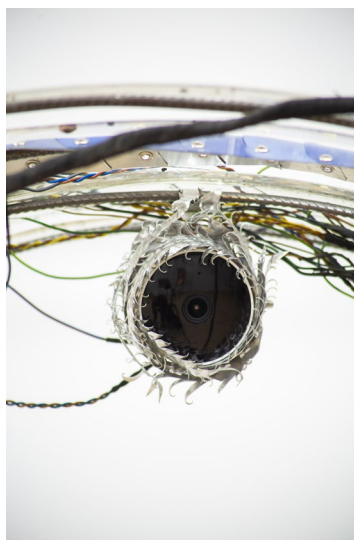
Anastasia Sosunova, DIY , 2023 - Installation vidéo