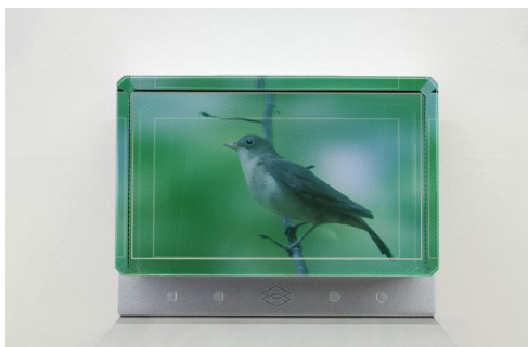
Deimantas Narkevičius (détail de l'installation), The Fifer , 2019, Vidéo couleur HD avec son stéréo (en boucle), écran holographique, photographie noir et blanc produite numériquement, objet en bronze moulé