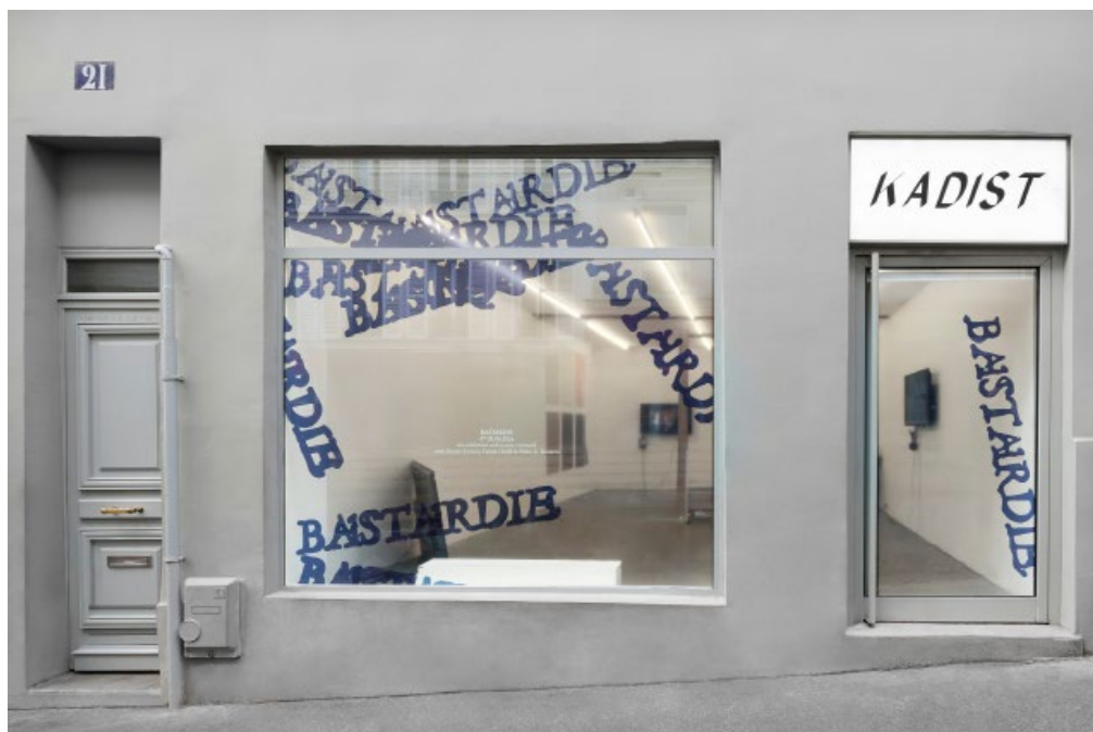
Bastardie, 2024, KADIST Paris

l'art en plus – Aude Keruzore a.keruzore@lartenplus.com +33 1 45 53 62 74