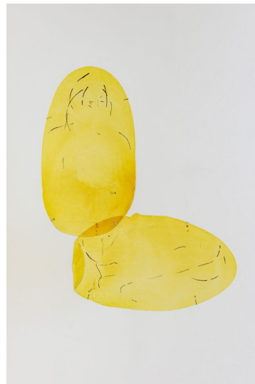
Marija Olšauskaitė, budinti (Oversee) , 2018-en cours - Vitrail