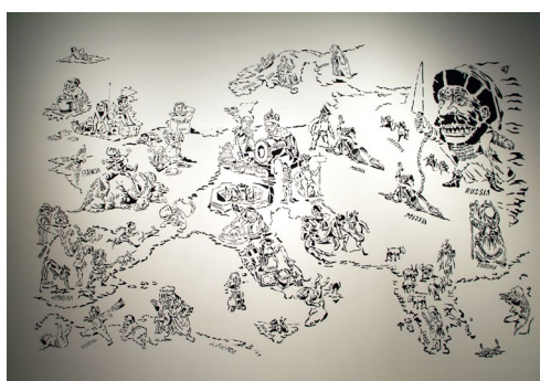
Nomeda et Gediminas Urbonas, Druzba , 9e Biennale de Lyon, 2007 - Vue d'exposition