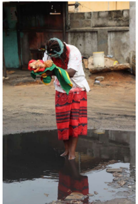
(2) Ras Sankara, Mémoire du sang , 2021, performance, photographie, 55 x 45 cm