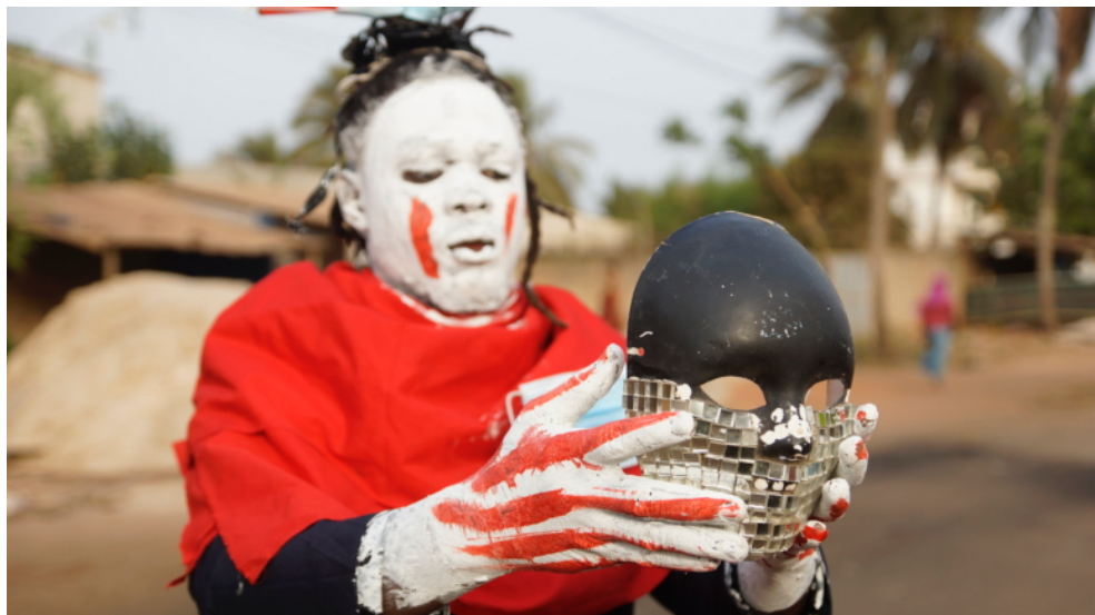
(4) Ras Sankara, Agbantè , 2021, performance, photographie, 60 x 50 cm