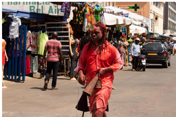
(5) Ras Sankara, Position du vent , 2022, performance, photographie, 40 x 50 cm