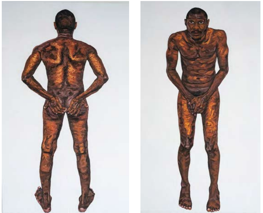
(2) Cache-cache (dyptique) , 2022, 130 x 110 cm, acrylique sur toile

Les œuvres de Nobel Koty révèlent la vulnérabilité de l'être humain, capturant des instants d'incertitude qui ouvrent la voie à une profonde introspection. Ces moments de doute sont essentiels à notre construction personnelle, développant notre empathie et notre compréhension des mécanismes qui parfois nous échappent. En invitant à une réflexion sur la condition humaine, il encourage chacun à explorer à son tour les méandres de sa propre existence pour mieux appréhender le monde qui nous entoure.