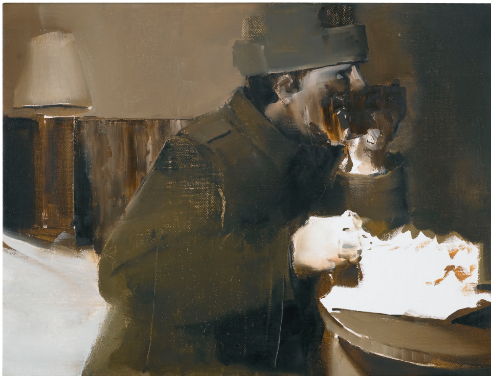
Adrian GHENIE, Hunger , 2008, huile sur toile

C'est au cœur du quartier historique de la ville de Senlis que la Fondation Francès diffuse depuis sa création en 2009, la collection Francès dédiée à l'art contemporain. Dans l'écrin d'une ancienne maison senlisienne, elle accueille gratuitement les amateurs d'art et les esprits curieux et partage avec eux sa sensibilité pour la création contemporaine.