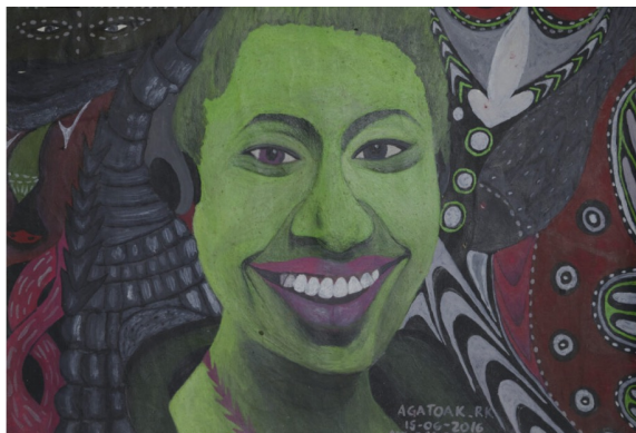
Agatoak Ronny Kowspi, sans titre, peinture sur papier, 2016 © Collection Francès

*L'association Françoise pour l'œuvre contemporaine , fondée par Estelle Francès en 2015, accompagne les artistes sur leur marché pour rompre leur isolement.