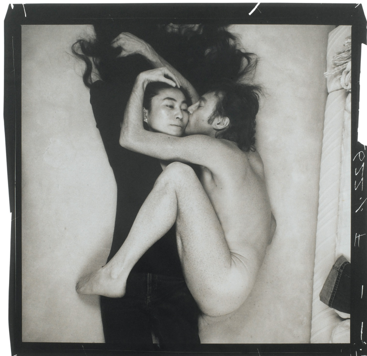
Annie LEIBOVITZ, John Lennon et Yoko Ono, New York 1980, 1980, tirage au platine

Dont le MO.CO. à Montpellier, le Museu de Arte Contemporânea à Lisbonne, au Portugal, Artipelag à Gustavsberg en Suède, ou encore le Kunsthal Rotterdam.