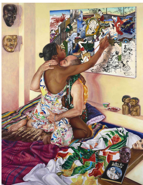
Nazanin Pouyandeh, SHUNGA #2 , huile sur toile, 2023

Par sa force d'interpellation et son esprit pédagogique, cette double exposition intitulée XXH 15 ans - Temps 1 puis XXH 15 ans - Temps 2, nous sensibilisera, informera et inspirera les publics, tout en confirmant le rôle engagé de la Fondation Francès dans les débats contemporains.