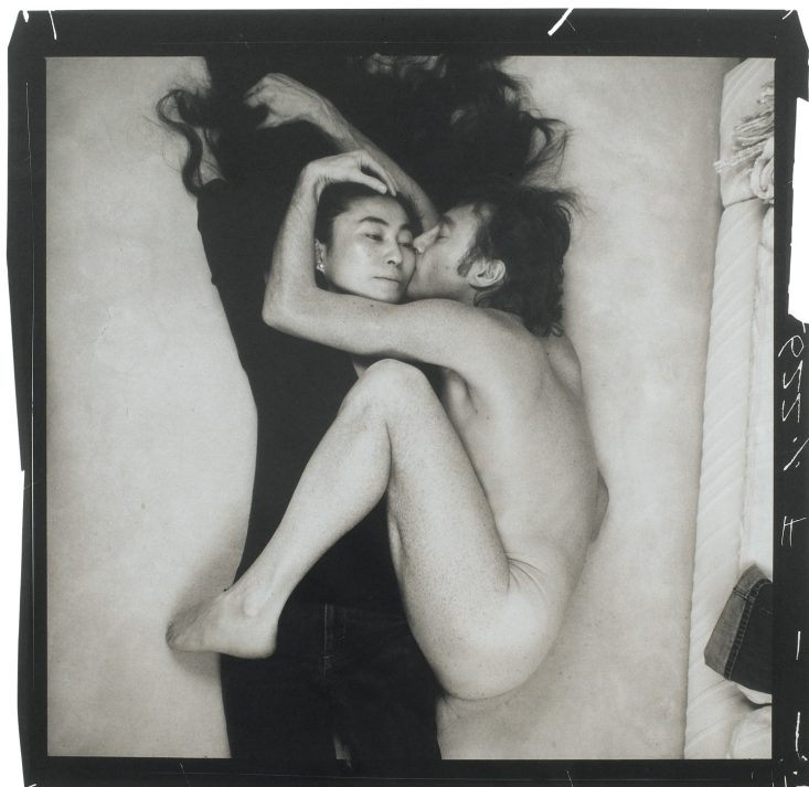
Annie LEIBOVITZ, John Lennon et Yoko Ono, New York 1980, 1980, tirage au platine

Dont le MO.CO. à Montpellier, le Museu de Arte Contemporânea à Lisbonne, au Portugal, Artipelag à Gustavsberg en Suède, ou encore le Kunsthal Rotterdam.